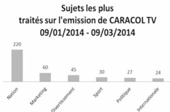
(Gráfico 2) Datos en francés (Lengua original del trabajo de investigación).

En el caso de la televisión, se recogieron los datos a través de un análisis de contenido de los vídeos de los titulares de la emisión de noticias de las 19:00 horas, los cuales fueron tratados categorizando estadísticamente la información que se muestra en un gráfico diario y otro final (ver gráfico 2):