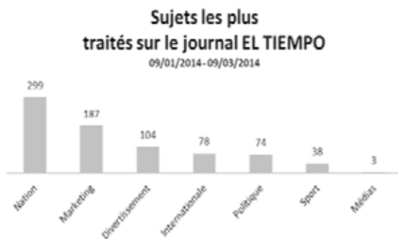
(Gráfico 3) Datos en francés (Lengua original del trabajo de investigación).

de la información se hizo con relación al número de centímetros dedicados al tema en cuestión en la portada o primera página de este diario. Este trabajo permitió conocer los hechos noticiosos que cubre este soporte en el país para hacer, posteriormente, una comparación con la información recogida en Twitter y la televisión (ver gráfico 3):