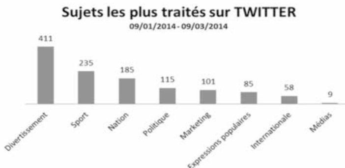
(Gráfico 1) Datos en francés (Lengua original del trabajo de investigación).

Es importante tener en cuenta que estos datos fueron producidos y prestados por dicha empresa a la aplicación de búsqueda que ofrece la red social Twitter llamada: Twitter Search App , desarrollada por dicha red social y que permitió procesar manualmente para clasificar los sujetos de actualidad y, posteriormente, crear gráficos en Excel con las visualización de dichas etiquetas, teniendo como resultado general lo siguiente (ver gráfico 1):