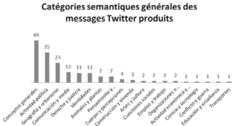
(Gráfica 6) Datos en francés (Lengua original del trabajo de investigación).