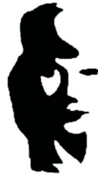
Foto 2:

vista percibe principalmente un conglomerado de piezas, por lo que el observador no alcanza a identificar exactamente dónde se producen los cambios en el aspecto global; no obstante, advierte hasta las mínimas modificaciones pero se presenta la dificultad de identificar su ubicación plenamente, hasta que se fija en los detalles.