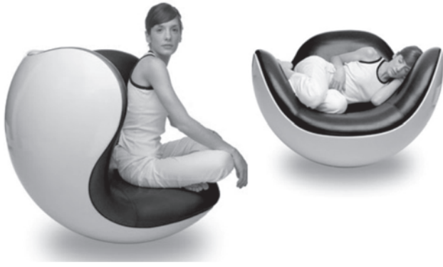
Foto 1: BIKIC, Michelle. (2008). At ICFE: Placentero Lounge Chair by Batti. http://3rings.designerpages.com/2008/05/27/icff-placentero-lounge-chair-by-batti/

La percepción juega entonces un papel fundamental al momento de interactuar con las formas en las cosas, pero antes de eso, debe producirse un impacto en el observador para que éste se sienta atraído y motivado a seguir el proceso de percepción, de allí surge el interrogante de ¿cómo se constituye la forma en lenguaje estético?, esto con el propósito de hacer del objeto un elemento no sólo funcional, sino también atractivo y con un plus de significado.