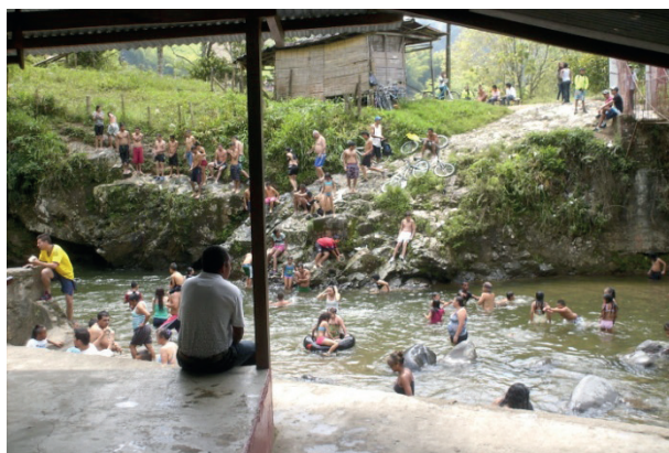
Figura 1. La Cristalina

Por esta razón, se vinculan en la investigación diversos conceptos de diferentes disciplinas: primero, el turismo rural definido como “un viaje o pernoctación en una zona rural, ya sea agrícola o natural, que cuenta con una baja densidad de población” (Gilbert, 1992, p.88), ya que no se planea convertir el espacio en centro de llegada del turismo en masas. Por el contrario, se requiere el fomento a las comunidades y a la gestión de conservación de ambientes naturales. Segundo, el concepto del desarrollo endógeno incide en un cambio de ideas, ya que para contribuir al desarrollo no es necesaria la importación de conocimientos; en cambio, la participación activa y ordenada de la comunidad debe integrarse en las discusiones de proyectos e intervenciones estrechamente relacionadas con el aspecto social. Al respecto, Vázquez (2009 p.56) afirma que: